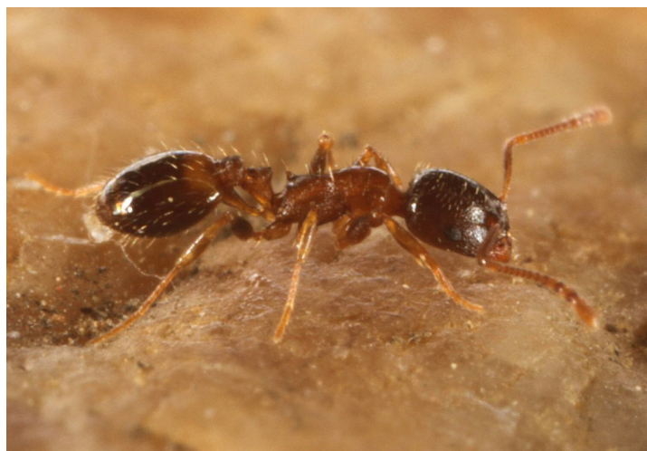
Figure 1. — Ouvrière de Temnothorax gredosi au mont Coronat / Imatge d'una obrera de Temnothorax gredosi a la muntanya Coronat / Picture of a worker of Temnothorax gredosi on mount Coronat.

In the course of the inventory on mount Coronat we located 13 colonies of Temnothorax gredosi (table II) between 902 and 1 572 m asl, all on the Northern slope of the mount (figure 3). The species spreads over several distant stations and is not rare in the area. A population thus seems to be well established on mount Coronat. The stations show various habitats, from an open and well exposed crest to the understory of a light beech forest. Given its ability to sustain various habitats, this species does not seem to be particularly endangered on mount Coronat.